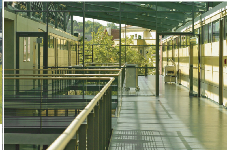
Bilder 1 und 2: Der transparente Neubau soll nicht abschrecken, sondern vermitteln.