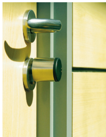
Bild 3: Elektronischer Schließzylinder mit berührungsloser Steuerung

Im gesamten Objekt sind über 230 elektronische Schließzylinder im Einsatz, deren Verwaltung über die Software Keyvi zentral gesteuert wird. Hier werden neue Schlüssel eingelesen, berechtigt oder Berechtigungen direkt am Arbeitsplatz entzogen. Mithilfe des Programmiergerätes können die letzten 500 Ereignisse am Arbeitsplatz ausgelesen werden. So entfallen weite Wege und machen die Verwaltung des Systems wirtschaftlich. Abwicklung und Realisierung des Objektes lagen ebenfalls bei einem regionalen Unterneh-